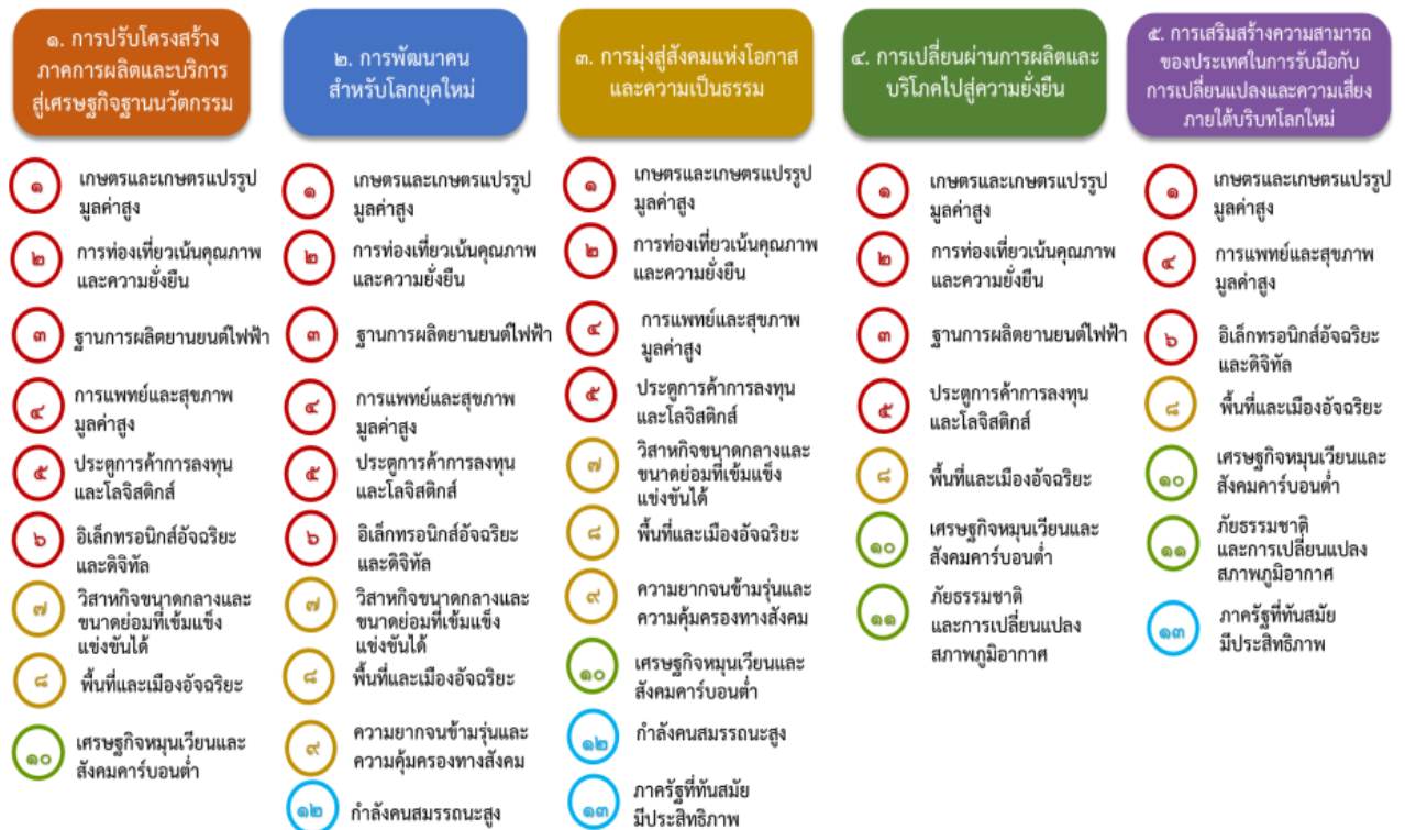
แผนภาพที่ ๓.๑ ความเชื่อมโยงระหว่างหมวดหมู่การพัฒนา กับเป้าหมายหลัก

ความเชื่อมโยงระหว่างหมวดหมู่การพัฒนา กับเป้าหมายหลักแสดงไว้ในแผนภาพที่ 3.1 โดยหมวดหมู่การพัฒนาที่กำหนดขึ้นเป็นประเด็นที่มีลักษณะเชิงบูรณาการที่ครอบคลุมการพัฒนาตั้งแต่ในระดับต้นน้ำจนถึงปลายน้ำ และสามารถนำไปสู่ผลพัฒนาทั้งในมิติเศรษฐกิจ สังคม ทรัพยากรธรรมชาติและสิ่งแวดล้อมไปพร้อมๆ กัน ทำให้หมวดหมู่แต่ละประการสามารถสนับสนุนเป้าหมายหลักได้มากกว่าหนึ่งข้อ นอกจากนี้การพัฒนาภายใต้แต่ละหมวดหมู่ไม่ได้แยกขาดจากกัน แต่มีการสนับสนุนหรือเอื้อประโยชน์ซึ่งกันและกัน